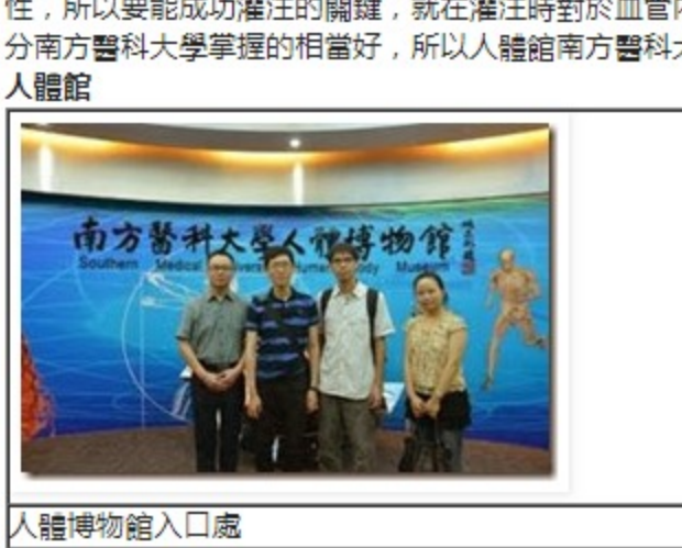
人體博物館入口處